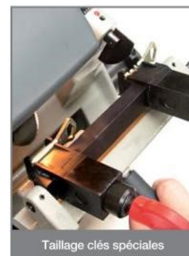
Taillage clés spéciales

Abus® et Abloy® sont des marques déposées.