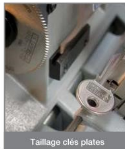
Taillage clés plates

Les étaux pivotants pour les clés à panneton et double panneton sont bi/trifaces et dotés d'un système de prise des clés spéciales du type Abus® et Abloy®.