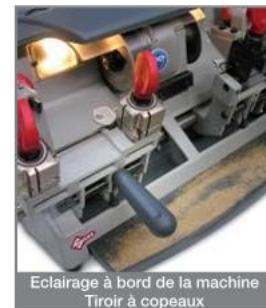
Eclairage à bord de la machine Tiroir à copeaux