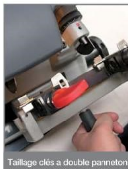
Taillage clés à double panneton

L'interrupteur général de la machine est doté d'un mécanisme de sécurité qui en garantit l'extinction automatique en cas de panne de secteur. Une