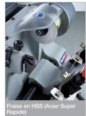
Fraise en HSS (Acier Super Rapide)