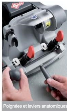
Poignées et leviers anatomiques

Les étaux rotatifs à 3 faces permettent une mise en place aisée d'une vaste gamme de clés sans devoir faire appel à des accessoires optionnels: à panneton, à double panneton, à pompes, clés pour boîtes postales, à butée centrale et clés spéciales du type Abloy®, Abus®, Luma® et Ava Chubb®.