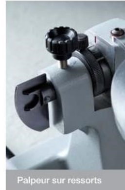
Palpeur sur ressorts