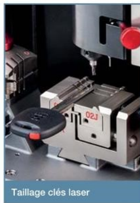
Taillage clés laser