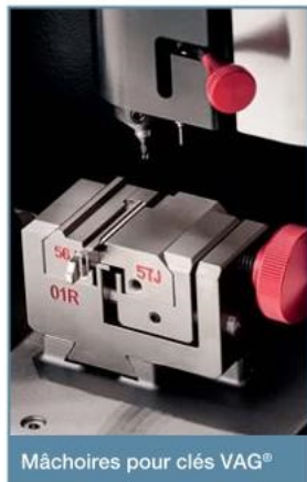
Mâchoires pour clés VAG®