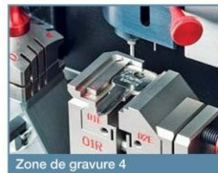
Zone de gravure 4