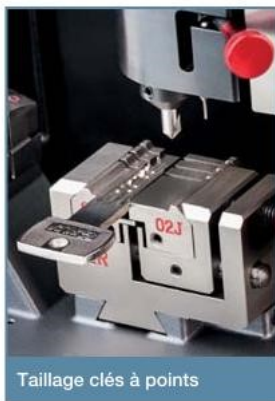
Taillage clés à points

Futura Pro Unlimited a 2 ports USB à l'arrière : une pour recharger complètement la