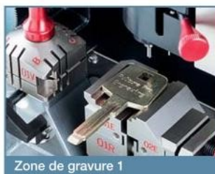
Zone de gravure 1

Le logiciel comprend la fonction Silca Software Interface (SSI) qui vous permettra de télécharger sur la machine des fichiers XML Keso® et DAT permettant de gérer des systèmes master.