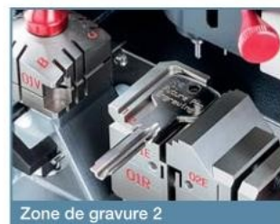
Zone de gravure 2