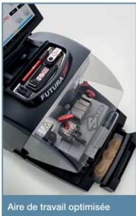
Aire de travail optimisée