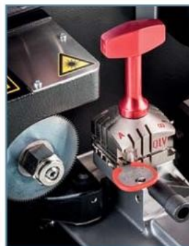
Station de taillage clés plates et cruciformes

Futura Pro Unlimited est contrôlée par écran tactile 10" qui vous guidera pas-à-pas dans les différentes phases de la reproduction et gravure de la clé, c'est la machine parfaite pour les reproducteurs inexperts. Le logiciel aide en effet à sélectionner le bon