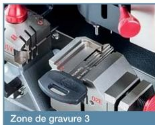
Zone de gravure 3