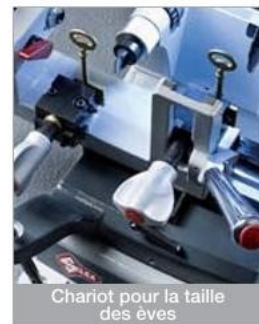
Chariot pour la taille des èves

Silca est toujours au plus près de ses partenaires. Le QR Code de bord permet une connexion immédiate via Smartphone à des instructions vidéo très utiles qui simplifieront et accéléreront toutes les opérations de maintenance et d'installation d'options sur la machine.