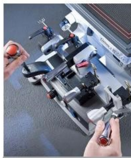
Poignées et leviers chromés

Vous pourrez reproduire de nombreuses clés en mode standard et vous pourrez faire votre choix dans une vaste gamme d'accessoires optionnels expérimentés.