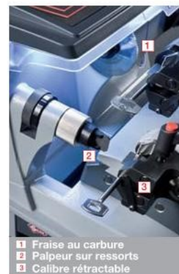
1 Fraise au carbure 2 Palpeur sur ressorts 3 Calibre rétractable

L'aire de rangement, intégrée à la machine, est particulièrement vaste et permet de déposer de nombreuses clés et tout type d'accessoires. L'aire porte-outils réservée aux contre-pointes (optionnelles) pour les clés femelles garantit un repérage immédiat. Les copeaux sont collectés dans un tiroir spécialement accessible. Cela permet ainsi de conserver un espace de travail le plus ordonné et le plus confortable possible.