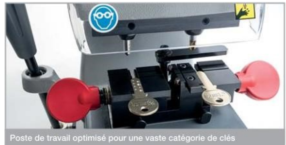
Poste de travail optimisé pour une vaste catégorie de clés

Les leviers et les poignées sur Swift Plus sont en technopolymère et leur forme ergonomique garantit une prise et un maniement aisé. Le mouvement du chariot