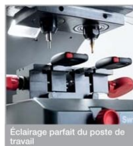
Éclairage parfait du poste de travail