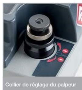
Collier de réglage du palpeur

Une pratique aire porte-accessoires au-dessus de la machine permet d'avoir les outils les plus courants toujours sous la main.